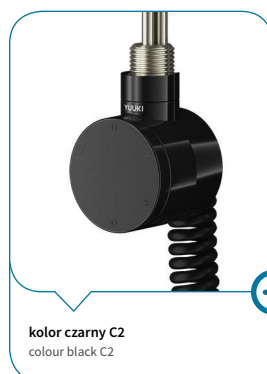
kolor czarny C2 colour black C2